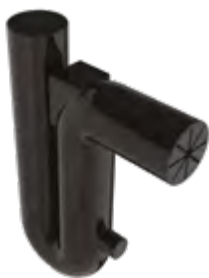
Přepadový sifon se zábranou proti hlodavcům